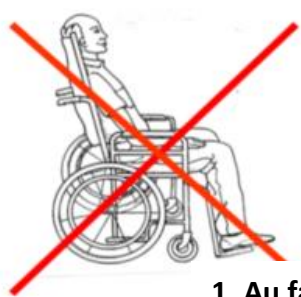
1. Au fauteuil

*Favoriser l'alimentation au fauteuil lorsque possible